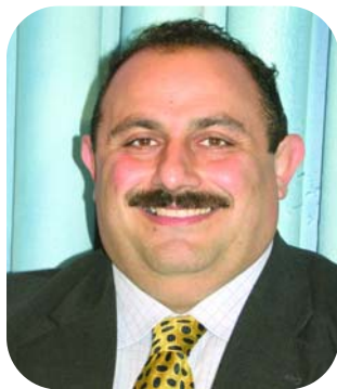
di Peppe Iannicelli

Comincia con eventi ed emozioni contrapposte la stagione più importante della recente storia calcistica partenopea. Dopo il brillante, ma forse sottovalutato, ottavo posto della scorsa stagione il Napoli si è ripresentato brillantemente sulla scena. In Europa ed in Italia. Il palcoscenico continentale offre agli azzurri una vetrina scintillante al cospetto del Benfica blasonata formazione lusitana. Il sorteggio non è stato generoso con gli uomini di Reja che forse avrebbero meritato un ostacolo meno insidioso prima dell'accesso alla fase a girone autunnale. La caratura tecnica partenopea è però tale da consentire ogni impresa sia al San Paolo sia allo Stadio da Luz.